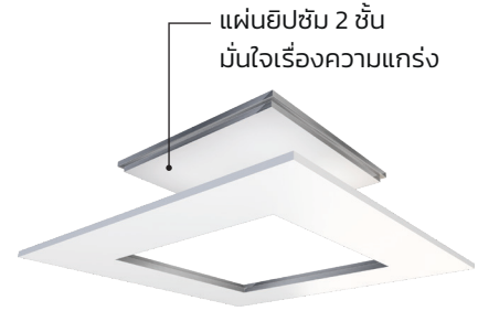
▶ รุ่นทูนขึ้น