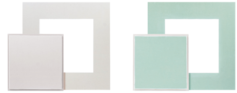
▶ รุ่นมาตรฐาน